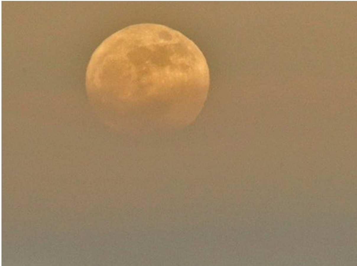
Abb. 4-17, Luna, die Navigatriss

Nun ist mir etwas passiert, muss ich beichten. Wie es geschehen konnte, ist mir noch nicht klar, aber es ist geschehen. Dabei habe ich doch aufgepasst, als ich nach einem der letzten Brote griff, die da noch in den Schachteln lagen. Ich habe mich mit Papierservietten darauf vorbereitet, allenfalls heraustropfende Saucen aufzufangen. Aber dann machte es «blubb», und eine Scheibe Gurke, die zwischen den akkurat geschnittenen Broten hervorkam, beladen mit Senf und Tomatensauce, fiel direkt auf meine Hose.