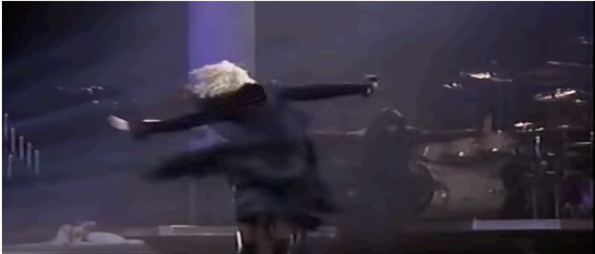
Abb. 2-26, Madonna Performing „Like a Prayer“ Paris Bercy 2015 und Songtext:

Gott Das Leben ist ein Mysterium, jeder muss alleine stehen. Ich höre dich meinen Namen rufen – und es fühlt sich an wie zu Hause.