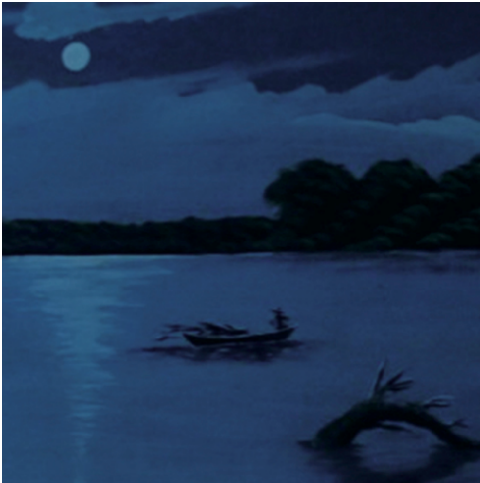
Abb. 2-23, Die Navigatriss besucht den Amazonas