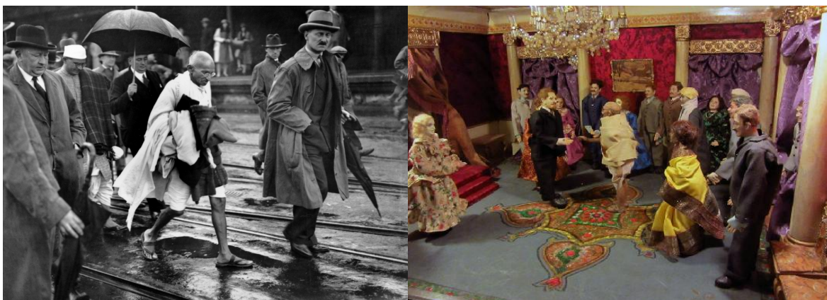
Abb. 2-21, Gandhi'ji in London, Abb. 2-22, bei King George im Buckingham Palace (1931)

„Der Mann, dem Hunderttausende Menschen huldigen, ist so von uns gegangen, wie er uns lehrte zu leben. Als einfacher Mann, ohne Güter, ohne Besitztümer, ohne offizielle Titel oder Ämter, er hat keine Armeen befehligt ... aber dennoch haben sich heute Regierungsoberhäupter und Würdenträger aus aller Welt vereinigt, um diesem kleinen braunen Mann im Lendentuch zu ehren, der sein Land in die Freiheit geführt hat.“